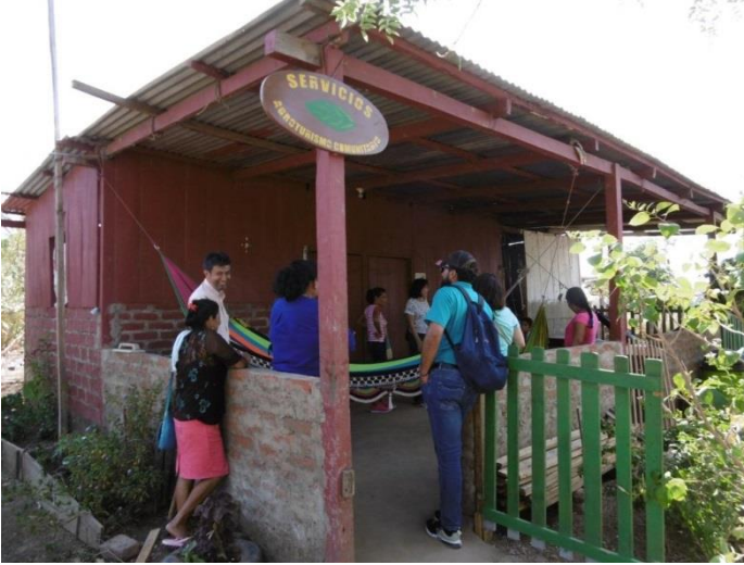
Visita familia beneficiaria (vivienda)