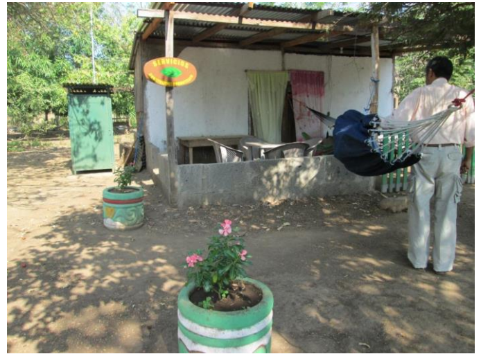
Visita familia beneficiaria (ornamentación-cartel)