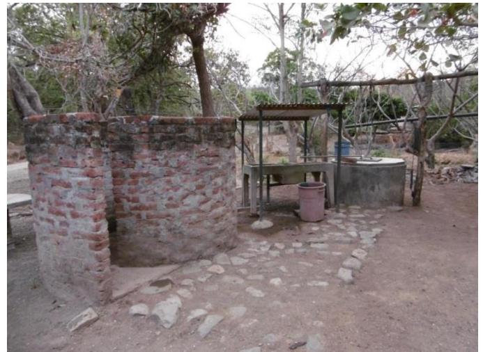
Visita familia beneficiaria (techado y limpieza exterior)