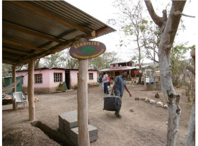
Visita familia beneficiaria (señalización y ornamentación)