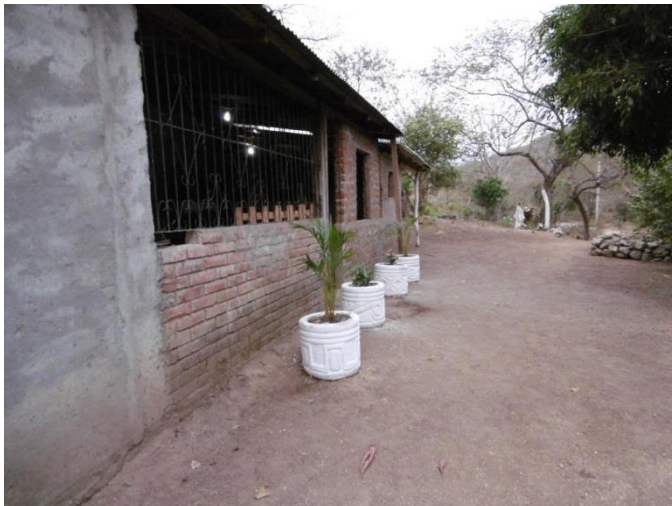
Visita familia beneficiaria (ornamentación-maceteros)