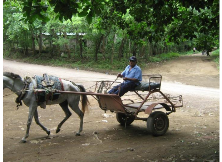
Visita circuito en El Túnel (Masaya)