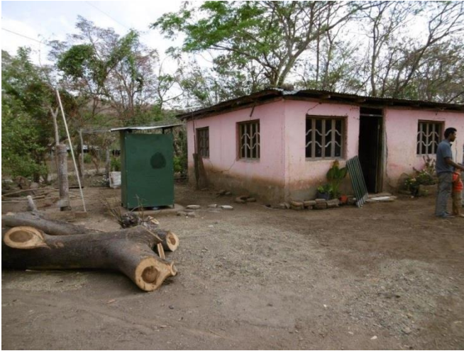
Visita familia beneficiaria (inodoro ecológico)