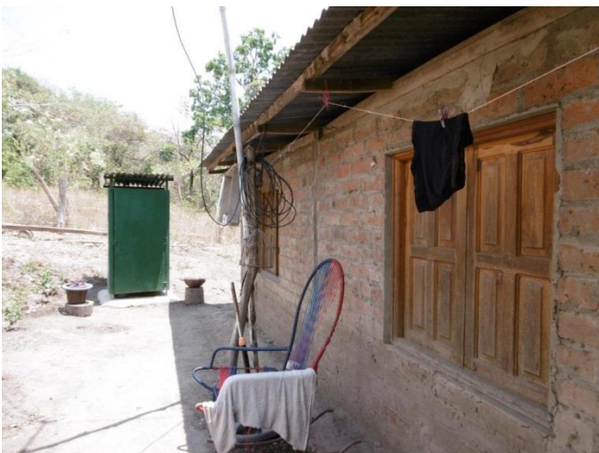
Visita familia beneficiaria (inodoro ecológico)