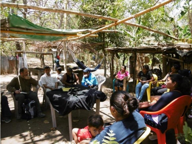
Reunión familias beneficiarias Masaya