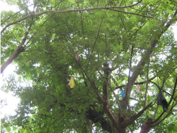
Visita circuito en El Túnel (Masaya). Residuos procedentes del vertedero municipal.