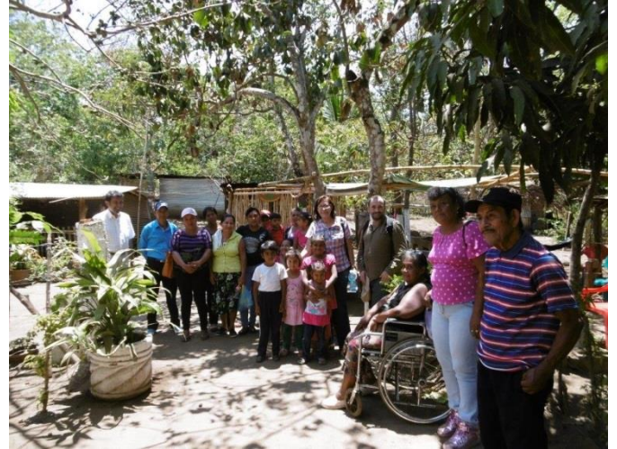
Reunión familias beneficiarias Masaya