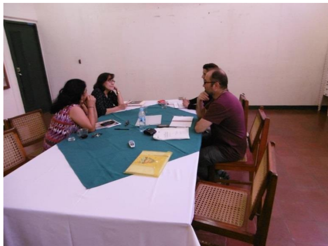
Reunión con equipo técnico del proyecto