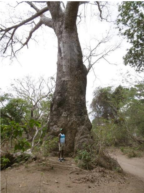
Visita circuito Tola (arbol monumental)