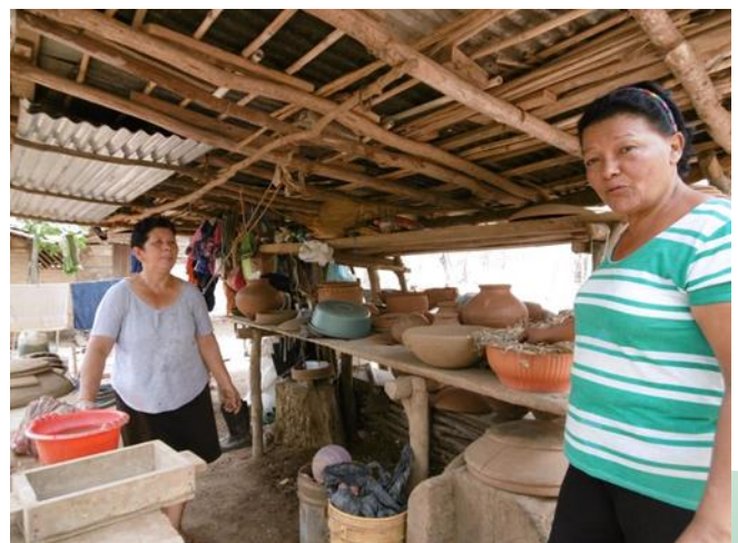
Visita circuito Tola (artesanía en barro)