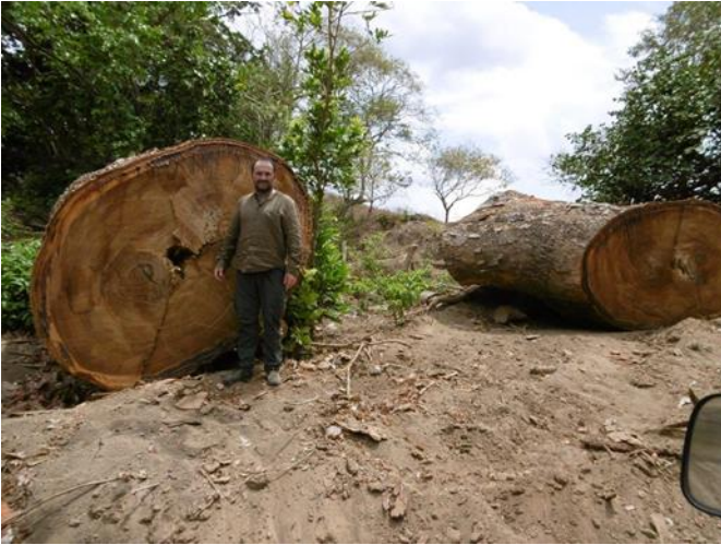
Visita circuito Tola