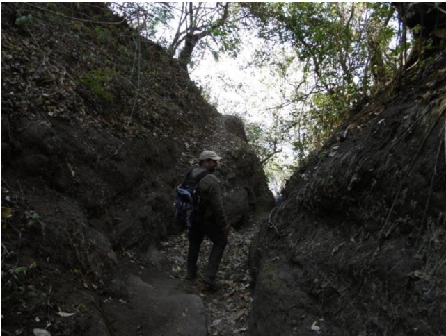
Visita El Jocote (Masaya)