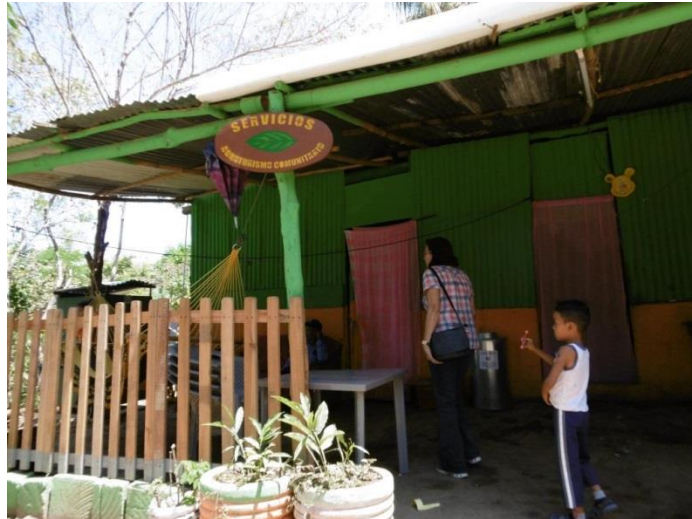
Visita familia beneficiaria (adecuación vivienda)