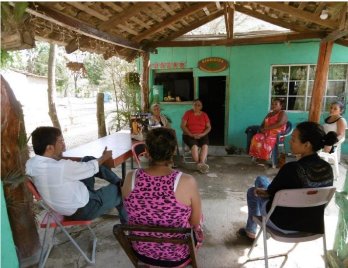
Reunión familias beneficiarias Limones y Lajal (Tola)