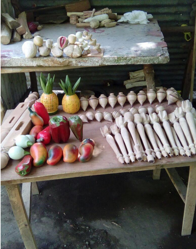
Visita tour Vista Alegre (Masaya). Artesanía