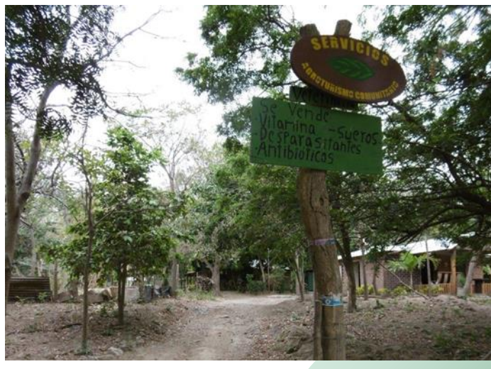
Visita familia beneficiaria (señalización)