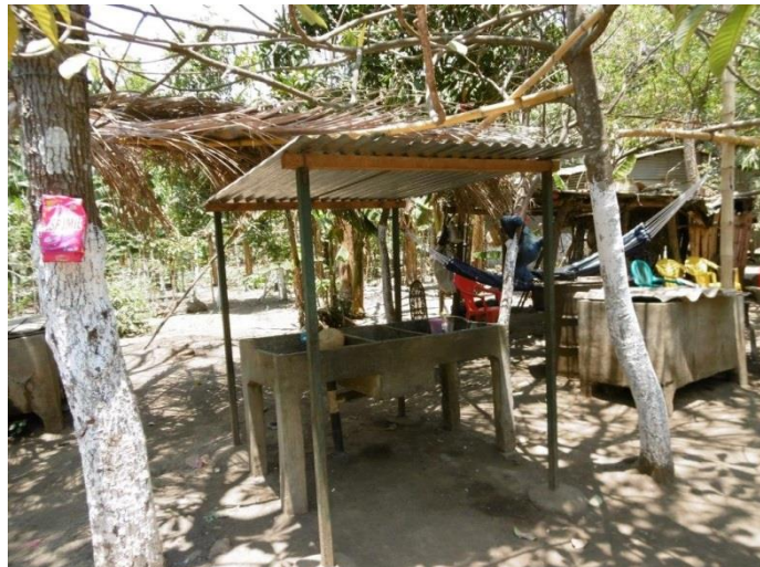
Visita familia beneficiaria (techado lavadero)