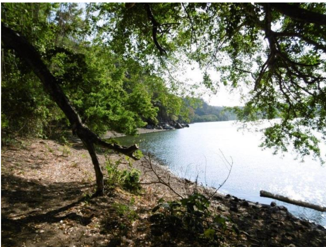
Visita El Jocote (Masaya)