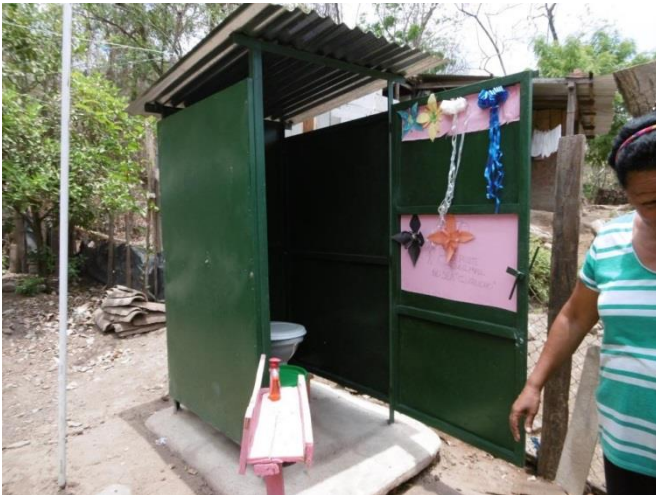
Visita familia beneficiaria (inodoro ecológico)