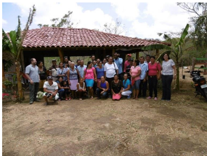
Reunión familias beneficiarias Tola