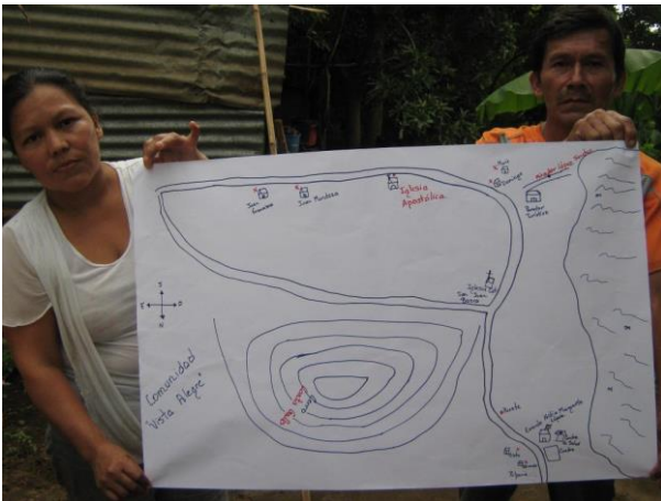
Visita tour Vista Alegre (Masaya)