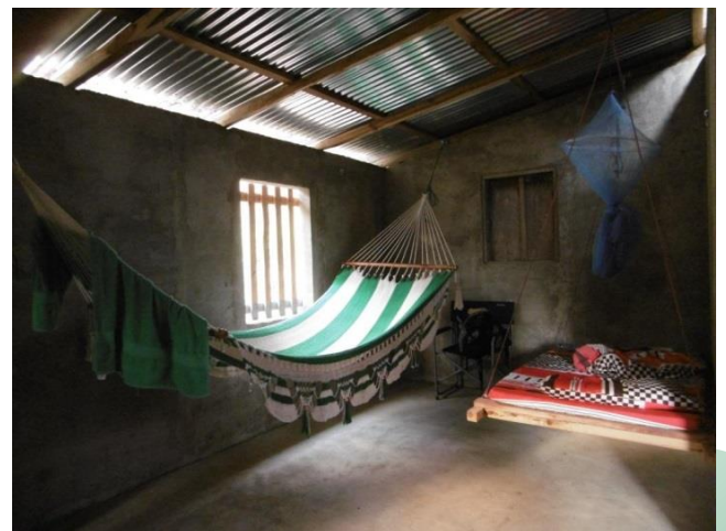
Visita familia beneficiaria (adecuación vivienda)