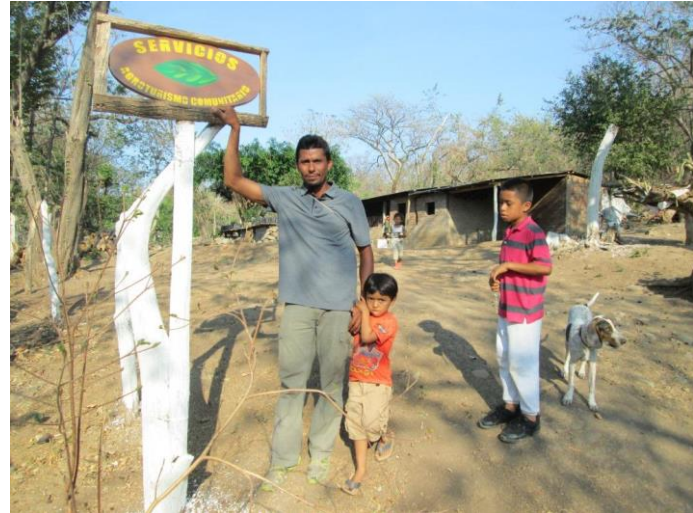
Visita familia beneficiaria (señalización)