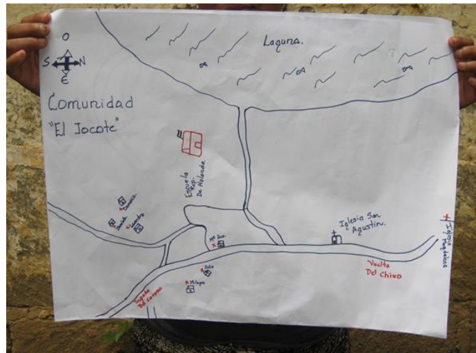
Visita El Jocote (Masaya)