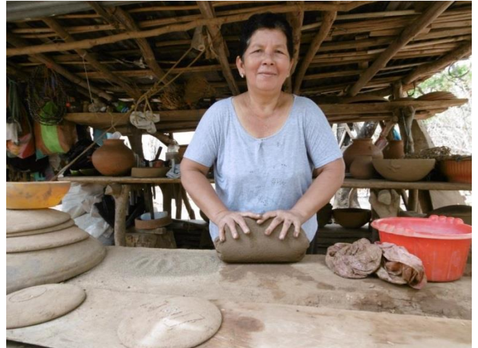
Visita circuito Tola (artesanía en barro)