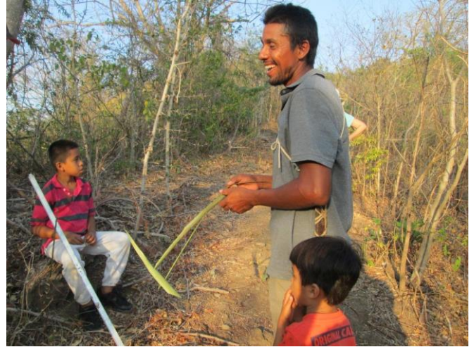
Visita Guastomate (Tola)