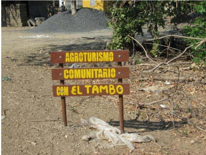
Visita familia beneficiaria (señalización)