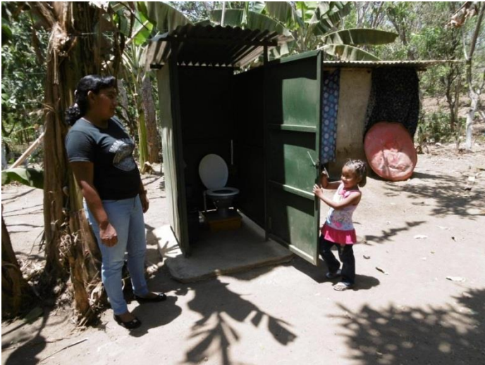
Visita familia beneficiaria (inodoro ecológico)