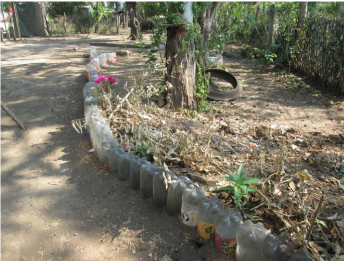
Visita familia beneficiaria (ornamentación)