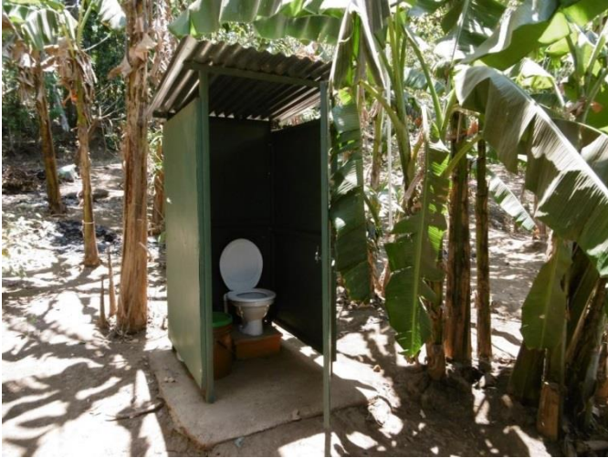
Visita familia beneficiaria (inodoro ecológico)