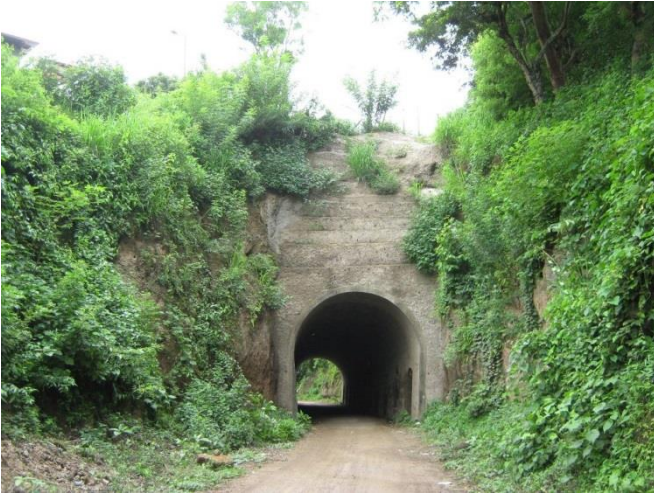
Visita circuito en El Túnel (Masaya)