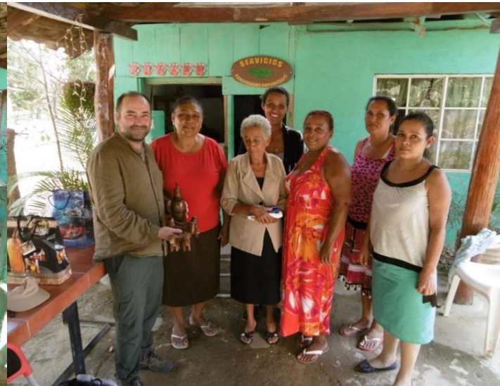
Reunión familias beneficiarias Limones y Lajal (Tola)