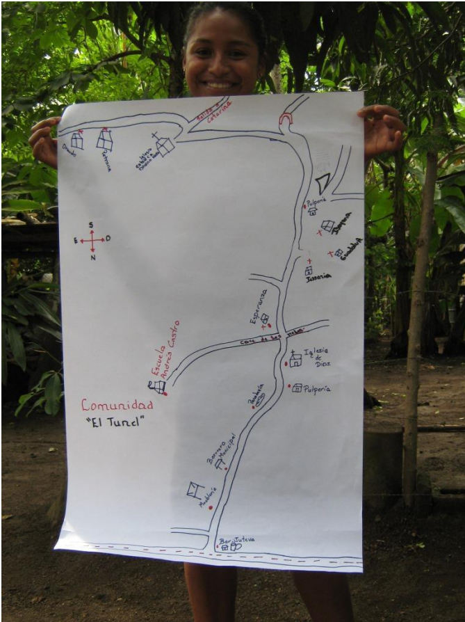
Visita circuito en El Túnel (Masaya)