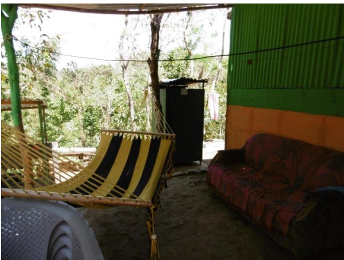
Visita familia beneficiaria (hamaca e inodoro)