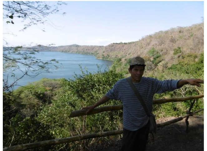
Visita El Jocote (Masaya)