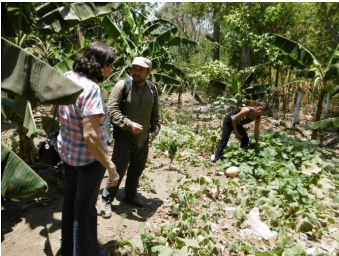
Visita familia beneficiaria (huerto familiar)