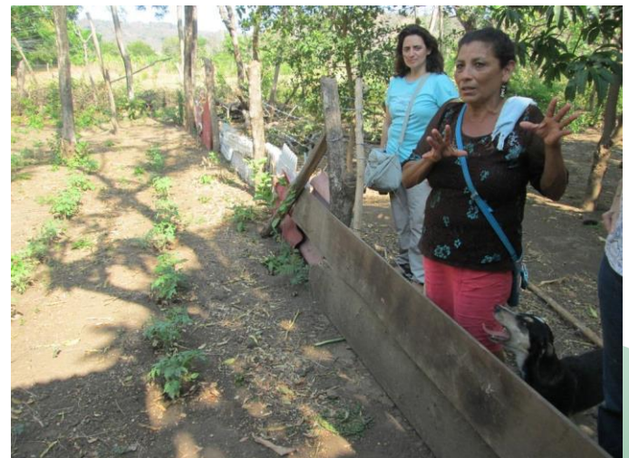
Visita familia beneficiaria (huerto familiar)