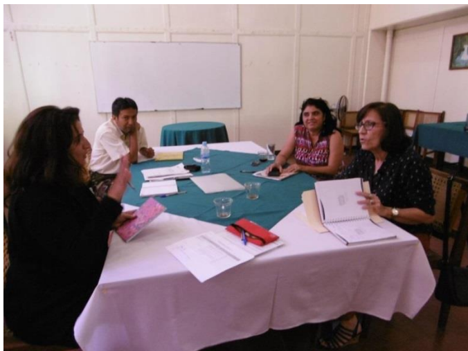
Reunión con equipo técnico del proyecto