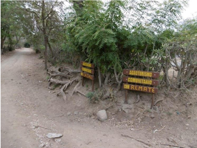
Visita familia beneficiaria (señalización)