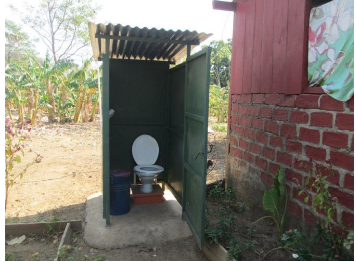
Visita familia beneficiaria (inodoro ecológico)