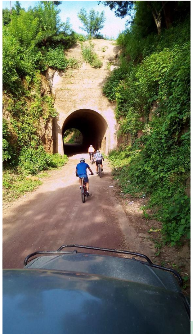
Visita circuito en El Túnel (Masaya)