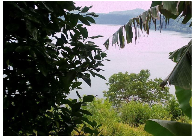
Visita tour Vista Alegre (Masaya)