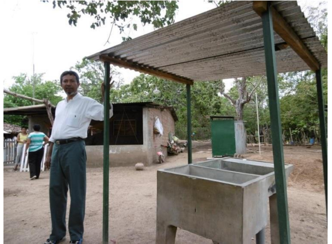
Visita familia beneficiaria (techado lavaderos)