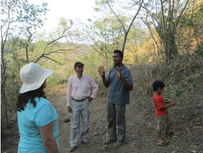
Visita Guastomate (Tola)