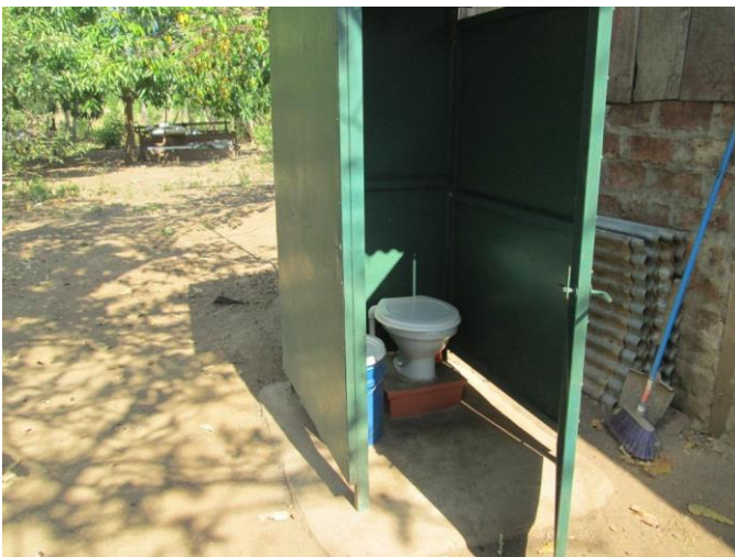
Visita familia beneficiaria (inodoro)