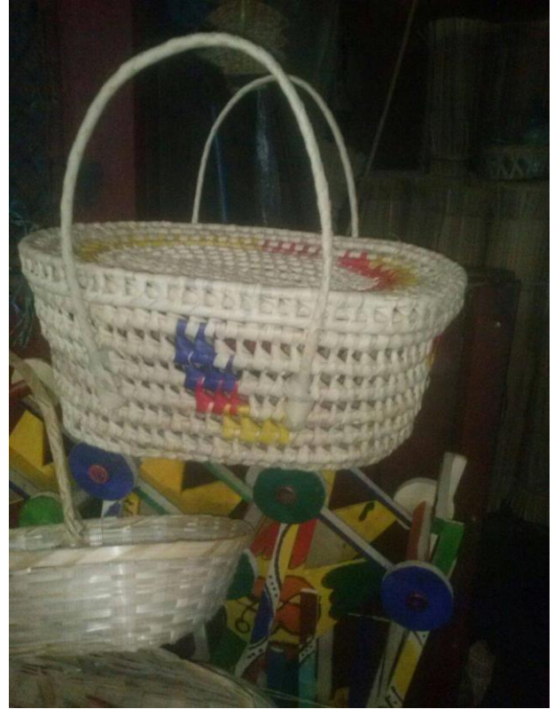
Visita tour Vista Alegre (Masaya). Artesanía