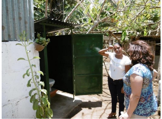
Visita familia beneficiaria (inodoro ecológico)