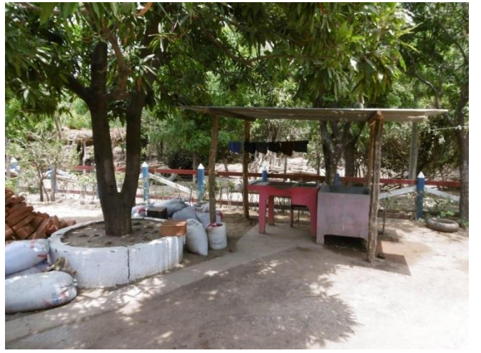
Visita familia beneficiaria (techado y ornamentación)