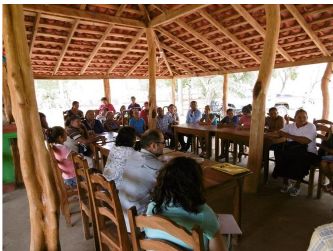
Reunión familias beneficiarias Tola