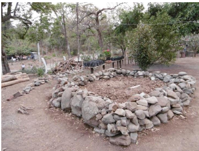
Visita familia beneficiaria (ornamentación exterior)